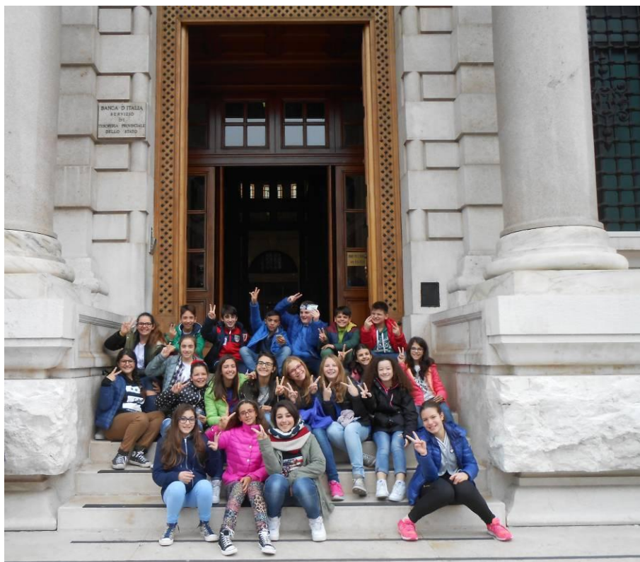
I ragazzi della 2°E

Wow!!! Che esperienza!!! E' stato interessante entrare in questa Banca diversa dalle altre!!! Il personale è stato molto accogliente nei nostri confronti e noi abbiamo imparato tante cose sulla nostra moneta. Ciao.